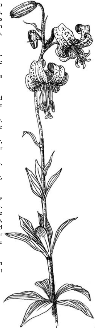
Lilium martagon - Türkenbund-Lilie