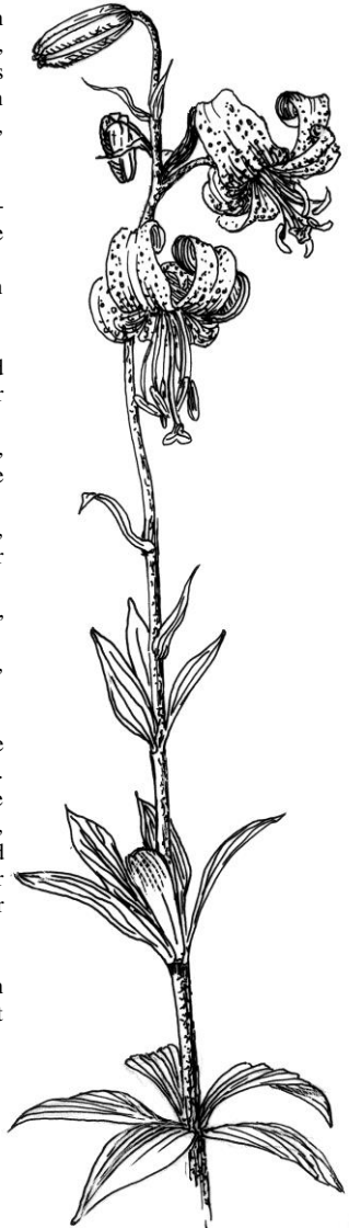
Lilium martagon - Türkenbund-Lilie